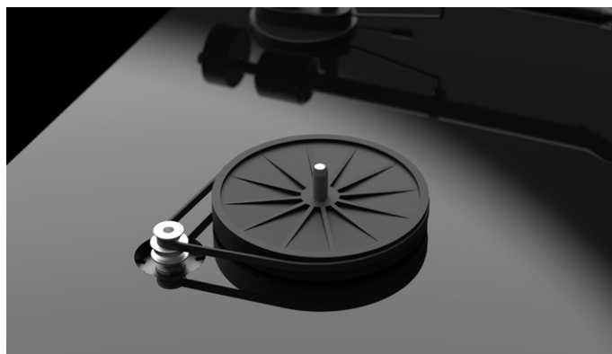
Besonders präzise Motor- und Subteller-Konstruktion

Der Plattenteller des T1 wird per Riemen angetrieben. Dieser überträgt präzise die Antriebskraft auf den neu designten Subteller, welcher wiederum in dem ultra-präzisen 0,001mm Plattentellerlager mit einem gehärtetem Edelstahlschaft in einer Messingbuchse sitzt.