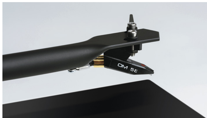
Hochqualitativer Ortofon OM 5E MM Tonabnehmer mit elliptischem Stylus

Der T1 ist der neue Shooting Star unter den leistbaren Plattenspielern. Die Fertigung in Europa erfolgt in einem Werk mit jahrzehntelanger Tradition im Plattenspielerbau. Genau das macht den T1 zu einem echten HiFi Plattenspieler, der klanglich sowie optisch überzeugt.