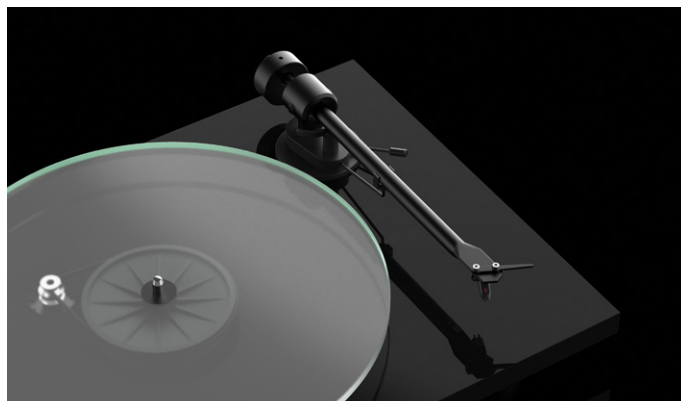
Einteiliger Aluminiumtonarm Robuste und steife Konstruktion für glasklaren Sound

Der T1 Tonarm ist eine neue Tonarmversion, die auf lang bewährten Pro-Ject Designs aufbaut. Der 8,6" lange Tonarm besteht aus einem einzigen Aluminiumstück und ist mit reibungsarmen Lagern bestückt, so dass die Abtastung stets mit absoluter Präzision erfolgt. Der vormontierte Ortofon OM 5E Qualitäts-Tonabnehmer mit elliptischem Nadelschliff macht diesen Plattenspieler zum einem echten HiFi Wiedergabegerät ohne Kompromisse. Darüber hinaus wird der T1 nicht - wie oft üblich - nur mit einfachen Cinch Kabel ausgeliefert.